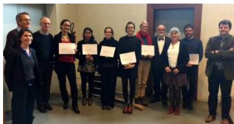
LES SIX LAUREATS