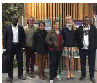
LES CANDIDATS DES POSTERS