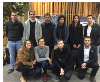
LES CANDIDATS DES PRÉSENTATIONS ORALES