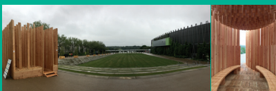
Parc des Expositions de la Beaujoire - Juin 2016 Nantes

Avec 550 exposants issus de 28 pays et 10 520 visiteurs de 70 nationalités différentes, les allées du Carrefour International du Bois 2016 ont été plus que jamais cosmopolites. Fidèles ou nouveaux venus, les participants saluent la promesse tenue par la manifestation : leur permettre d'être, pour 3 jours, en prise directe