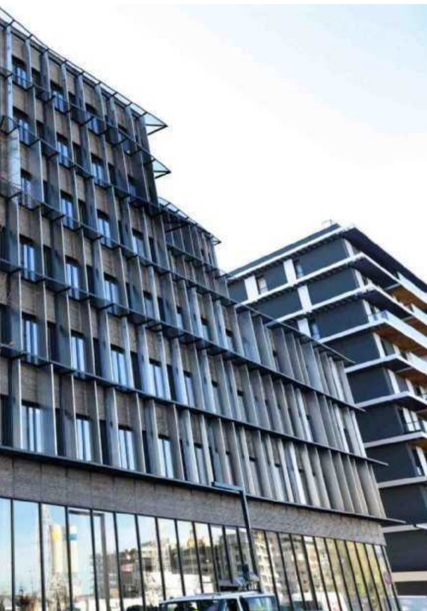
On ne le devine pas de l'extérieur, mais Perspective est le plus haut bâtiment d'affaires en bois de France.