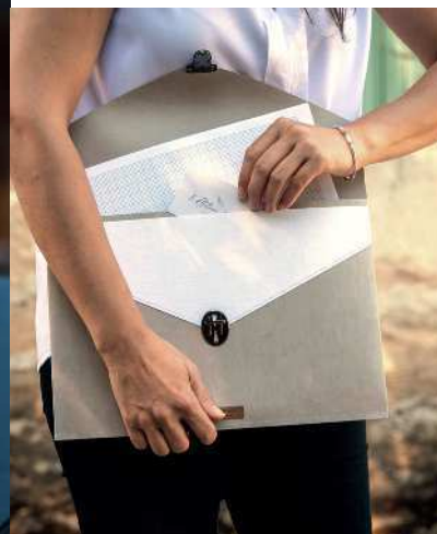
Vide-poches, porte-documents, étui à stylos et autres accessoires composent la collection 100 % naturelle de la marque