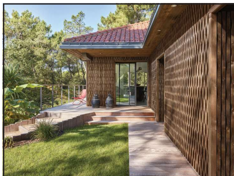
Bardage en tasseaux RythmixOndes par ISB

L'après-midi, le focus est mis sur un enjeu crucial : la protection incendie dans l'architecture bois. Explorez les solutions innovantes et les technologies émergentes qui façonnent l'avenir de la sécurité dans la construction bois.